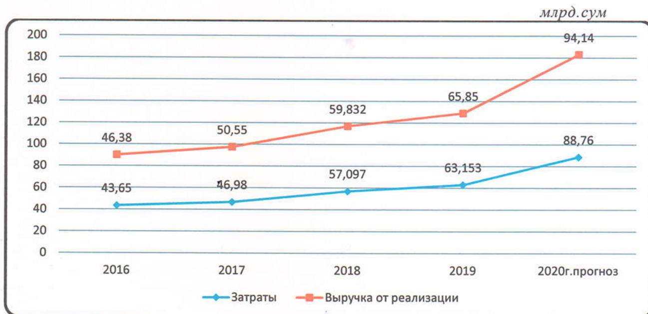
Рис 4. Основные экономические показатели деятельности АО ELEKTRQISHLOQQURILISH

Для более наглядного отображения показателей построена диаграмма (рис 4.)