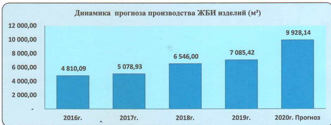
Рис. 2. Динамика прогноза производства ЖБИ изделий 2016-2020гг.

Как видно из рисунка №2 общий прогноз производства промышленной продукции в 2019 году увеличилось на 8,2% в сравнении с 2018 годом. В основном, увеличение от плановых (прогнозных) величин объясняется в высокой потребности в промышленной продукции. В 2020 году планируется увеличение объема до 9928,14 м 3 за счет увеличения строительно-монтажных работ