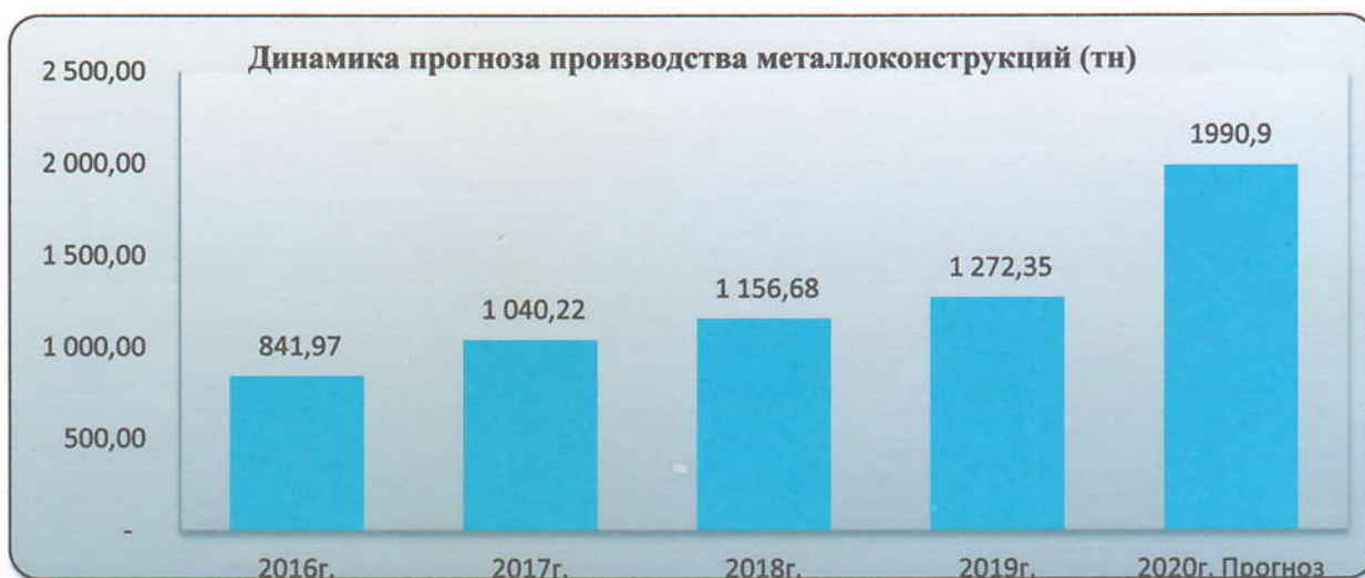
Рис. 3. Динамика прогноза производства металлоконструкций и ТНП изделий 2016-2020гг.

Так же АО «ELEKTRQISHLOQQURILISH» выпускает металлоконструкции и товары народного потребления, на рисунке №3. приведена динамика прогноза производства.