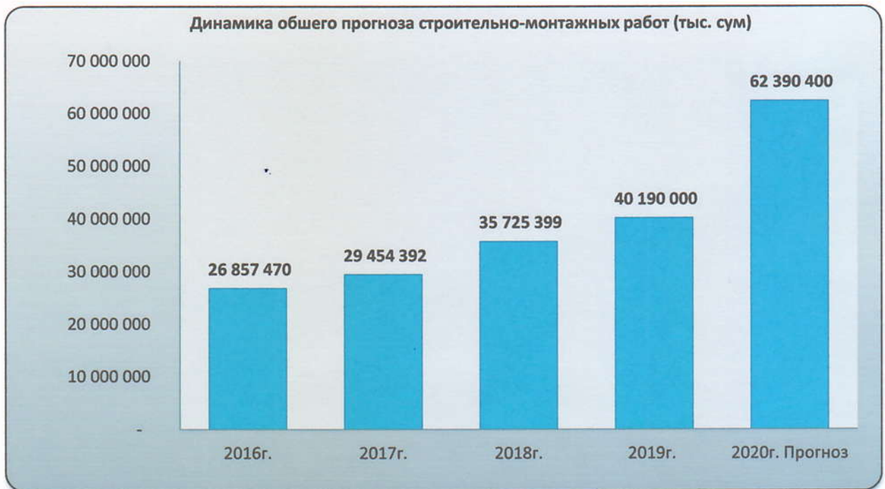
Рис. 1. Динамика роста прогноза строительно-монтажных работ 2016-2020гг.

На рисунке 1. приведена динамика прогноза строительно-монтажных работ до 2020 года.